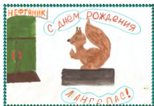
Морозова Катя 4 «В»